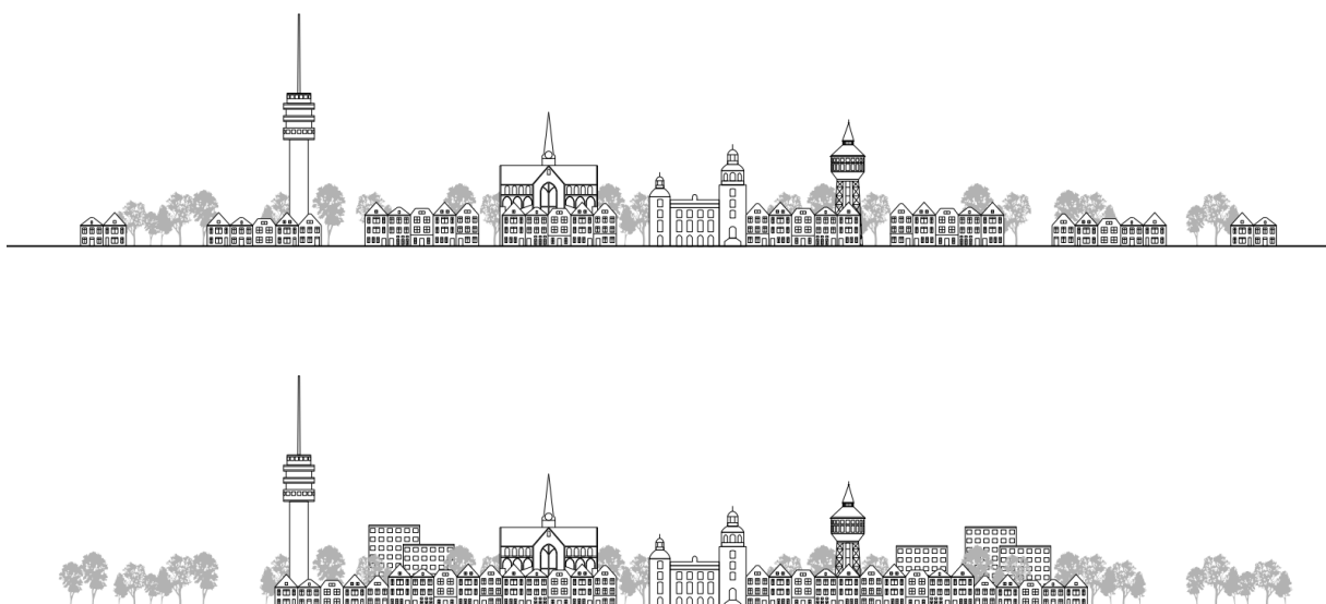
Afbeelding 2.1: Goes als compacte stad

Eén van de belangrijke kwaliteiten van de stad Goes is haar compactheid, en de directe nabijheid van aantrekkelijk landschap. In een compacte stad liggen de meeste dagelijkse voorzieningen op loop- of fietsafstand van iemands huis. Dit vermindert de afhankelijkheid van auto's en verbetert de levenskwaliteit, omdat in de dagelijkse leefomgeving veel potentiële ontmoetingspunten ontstaan. Mensen hoeven daarbij minder afstanden af te leggen, en het is mogelijk goede fiets- en wandelpaden aan te leggen en te onderhouden. Dit zorgt voor minder verkeer en vervuiling. Om ervoor te zorgen dat zo'n compacte stad leefbaar blijft, is het belangrijk veel aandacht te hebben voor groen in en rond de stad. Goes ligt centraal in een groenblauwe oase. We zijn omringd zijn door groen poellandschap, polders en water, zoals het Nationaal Park Oosterschelde en het Schengegebied. Deze band met het omliggende landschap en de natuur willen we versterken.